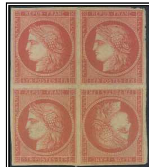
Ex. Collection La Fayette © Pascal BEHR

Le bloc de 4 du 1F Vermillon vif avec tête-bêche (case 35 de la demi-feuille de 150) constitue la pièce la plus prestigieuse de la philatélie française et une star mondiale. Sa cote dans le catalogue Yvert et Tellier - 1.250.000 Euros - en est l'illustration.