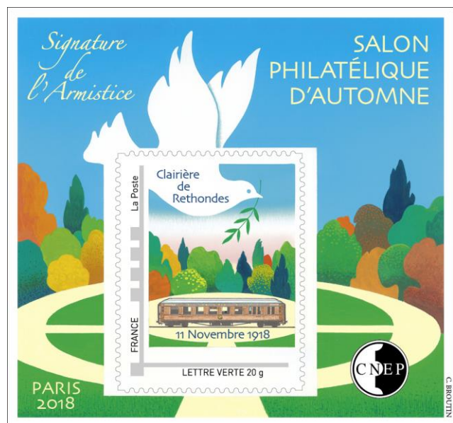
Bloc CNEP - Illustration originale de Christian Broutin

La CNEP enrichira sa collection par l'émission d'un bloc intégrant un timbre à l'effigie du wagon dans lequel fut signé l'Armistice entre la France et l'Allemagne. Ce que l'on sait moins, c'est que ce wagon (situé dans une clairière de la forêt de Rethondes) n'existe plus. Pour la petite histoire, Hitler en fit un symbole et exigea que l'Armistice du 22 juin 1940 y soit signée. Puis il fit emmener la voiture à Berlin pour l'y exposer, avant de la détruire quelques semaines avant la capitulation allemande.