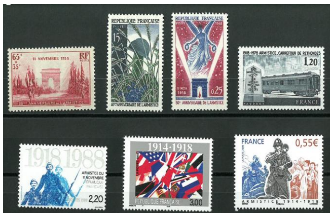
Les timbres émis depuis 1938 pour illustrer l'Armistice du 11 novembre 1918.