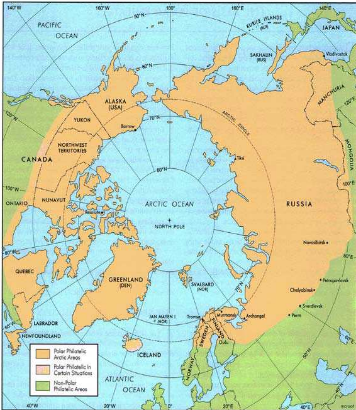
Fig. 1: Polar Philatelic Arctic