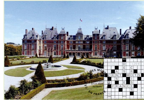
Face ouest du château d'Eu avec ses jardins à la française

ENVELOPPE FDC grand format avec le bloc de un timbre