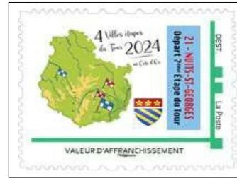
Visuel d'un timbre