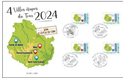
Enveloppe (22,9 x 16,2 cm) avec 4 Timbres