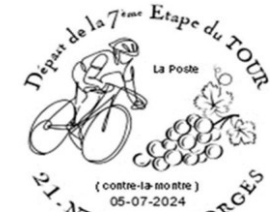
Visuel d'une oblitération

BON DE COMMANDE à envoyer à : Lucien Poulet - 17B, place Marie Maignot - 21700 Nuits Saint Georges - Mail : lucpinceau8juin@gmail.com. Tél : 06 45 01 37 69 - Chèque à l'ordre de : Cercle philatélique Varois St Apollinaire ou par virement : RIB : FR76 10278 02513 00020455401 77