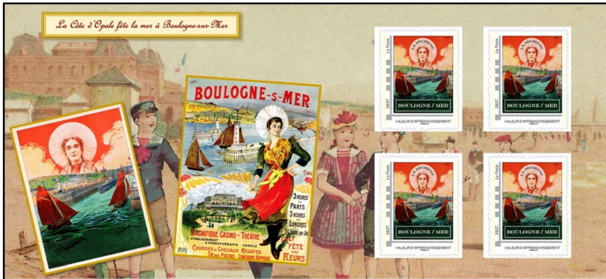
Collector de 4 timbres